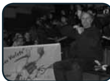
La cigogne et les violets...