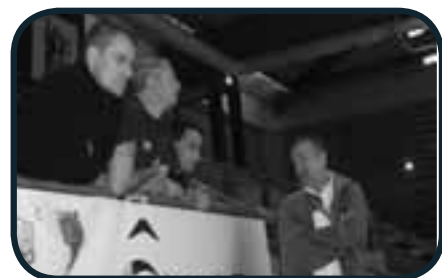
Le Président vient nous voir ...