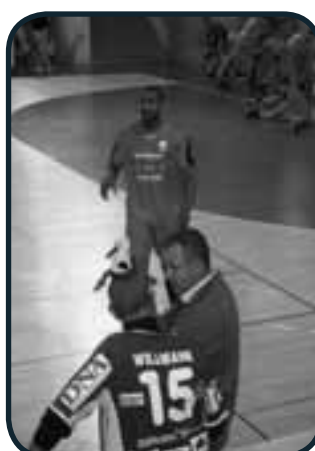
Le Président et le Président !!!