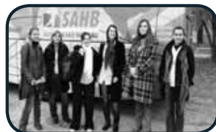
Oh les filles Oh les filles!!!