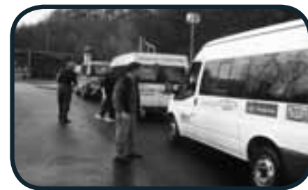
Tout le monde en voiture ...