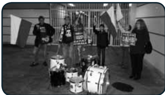
A Villeurbanne avant l'heure ... c'est pas l'heure !!!