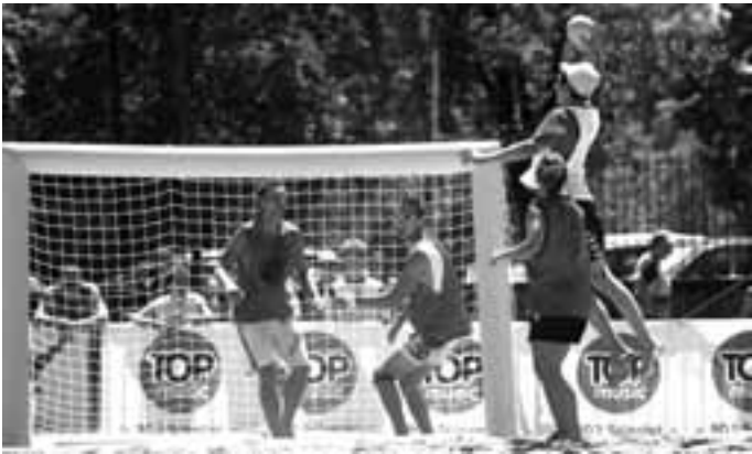
Les images fortes de l'édition 2007