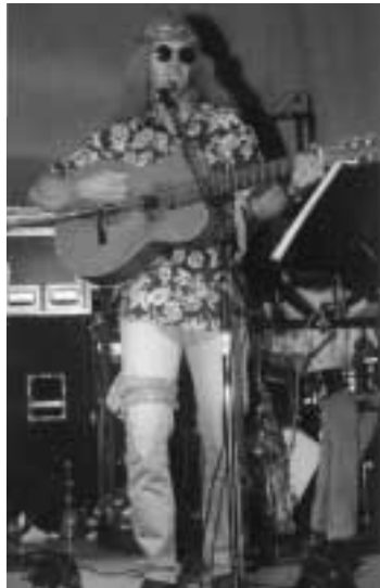
La star en solo