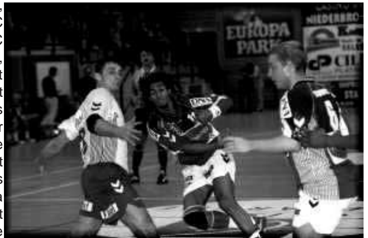
Coupe d'Europe en 2002/2003.

Je suis Sélestadien et fier de l'être et le discours des dirigeants, chez lesquels j'ai senti une grande motivation, m'a convaincu. » Contacté par des clubs français et étrangers, le meneur de jeu du SCS, auteur d'un Challenge Maranne qui a marqué les esprits pour ses débuts internationaux, tentera d'aider son club dans l'objectif qu'il s'est fixé : disputer une