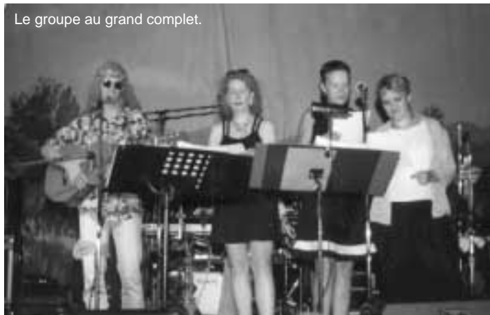
Le groupe au grand complet.

au hasard d'une fête cet été dans son rôle de star du show biz. Vous aurez peut-être un peu de mal à le reconnaître dans son habit de lumière mais le déguisement était pour lui obligatoire sous peine de se voir poursuivi par un membre du club en quête d'un jeu de maillot ou d'un conseil de coaching.